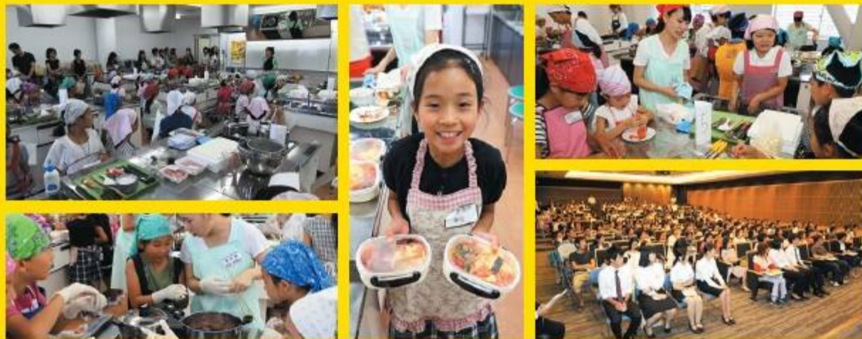
※画像は昨年開催の様子